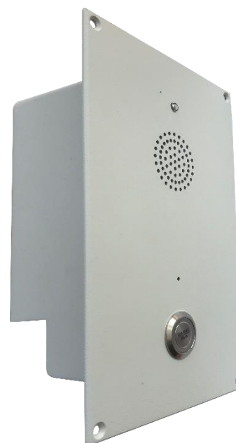
Исполнение TSCT -01-06, TSCT-01-07, TSCT-01-08, TSCT-01-08,