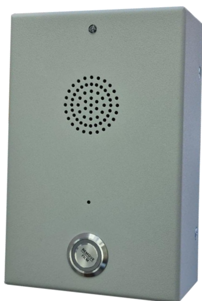
Исполнение TSCT -01-02, TSCT-01-03, TSCT-01-04, TSCT-01-05

Внешний вид TSCT-01 представлен на рисунке 1.